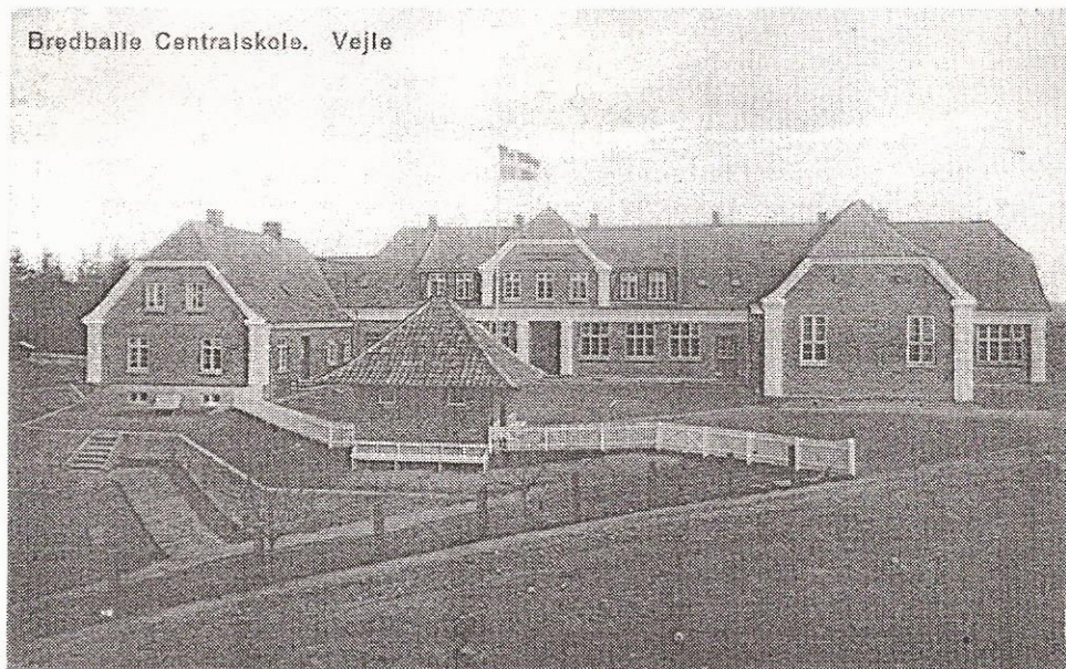
Bredballe Centralskole. Vejle