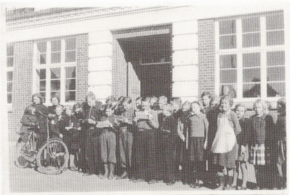
Eleverne i Bredballe Centralskole læser OPROP den 9. april 1940